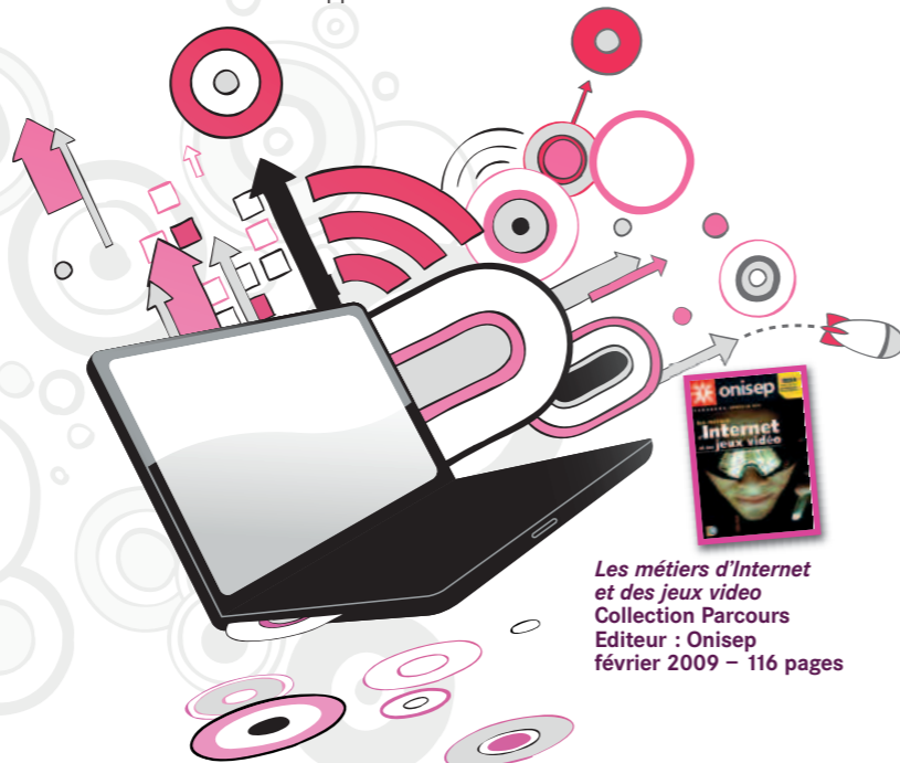
Les métiers d'Internet et des jeux vidéo Collection Parcours Editeur : Onisep février 2009 - 116 pages