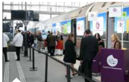
Le wagon des organismes de formation et des entreprises