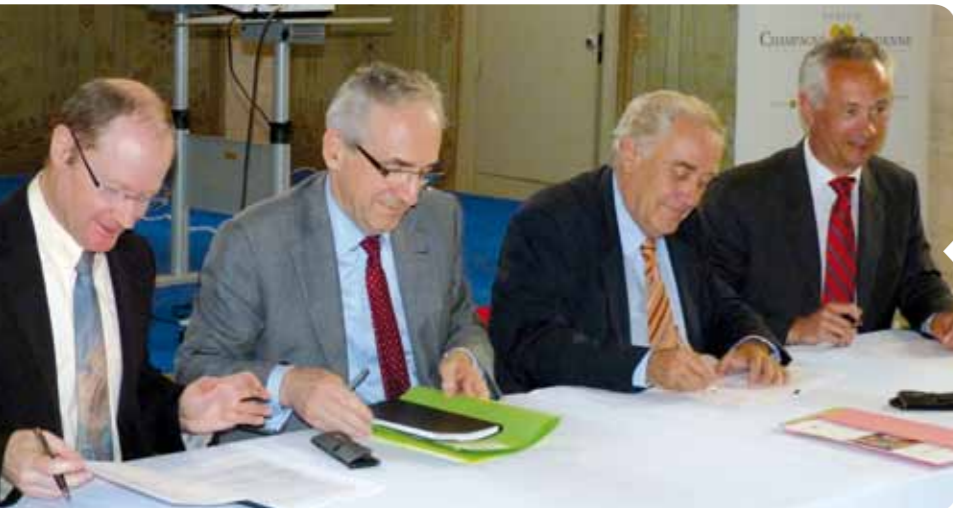
Signature du Contrat de Plan Régional de Développement de la Formation Professionnelle (CPRDFP) le 15 juin dernier.