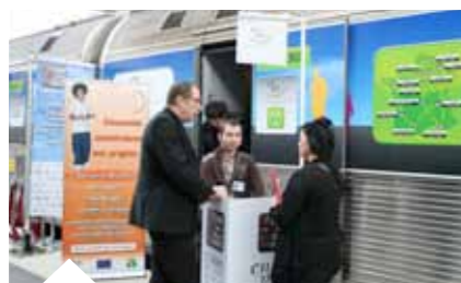
Les conseillers du réseau des Missions locales se sont mobilisés pour accueillir les jeunes et proposer des solutions pour la formation, l'orientation, l'alternance et l'emploi. ( www.missionslocales-champagneardenne.com )

Après Marseille et avant de rejoindre Bordeaux, la 4 e édition du train pour l'emploi et l'égalité des chances a fait étape en gare de Reims. Fervents défenseurs de l'égalité des chances, des dizaines d'employeurs, des organismes de formation et des intermédiaires de l'emploi étaient présents.