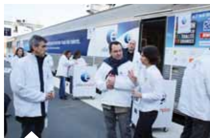
Le wagon de Pôle emploi Champagne-Ardenne