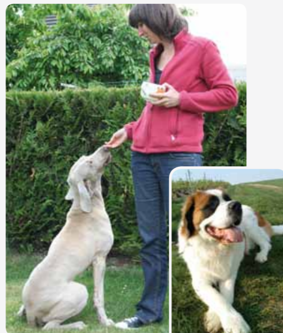
Patoumours, 60 kg