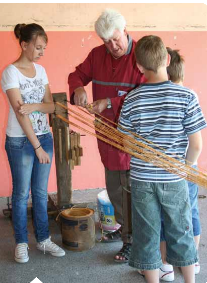
L'atelier cordage de l'outil en main de Bar-sur-Seine